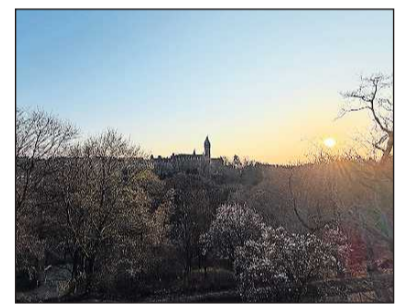
Spektakulärer Blick über das Petrus-Tal.