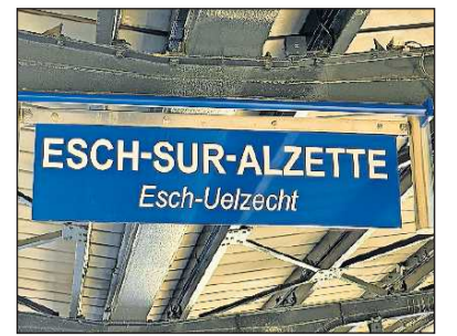
Die Kohle- und Stahlstadt Esch liegt im Südwesten.

Auch politisch steht Luxemburg im Vergleich zu seinen Nachbarländern gut da. Während in Frankreich, Belgien und Deutschland die Rechtspopulisten an die Macht drängen, spielen sie in Luxemburg nur eine Nebenrolle. Christdemokraten, Sozialdemokraten, Liberale und Grüne geben im Parlament den Ton an und bilden in wechselnden Koalitionen stabile Regierungen.