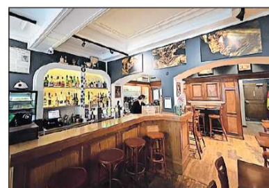
Urig eingerichtet: das „Bistro de la Presse“, direkt vis-à-vis vom Palast des Großherzogs.

Weil in der Gastronomie kaum noch gebürtige Luxemburger arbeiten, ist die Szene inzwischen sehr international. Die Bistros im Bahnhofsviertel und überall sonst in der Hauptstadt sind zur Mittagszeit oft bis auf den letzten Platz besetzt, Küche und Ambiente sind überaus vielfältig. Toll sitzt man etwa im „Madame Jeanette“, wo bestechend gut surinamesisch (!) gekocht wird.