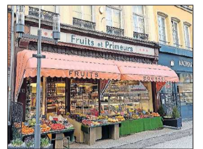
Gut sortiert: Feinkost-Laden in der Oberstadt.