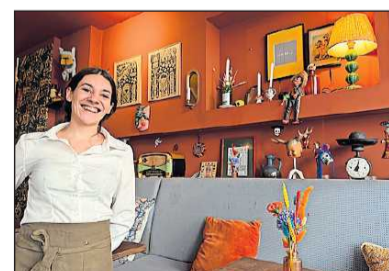
Agostina aus Argentinien serviert im „Madame Jeanette“ surinamesische Gerichte.

Diese Gerichte sind heute in Gastwirtschaften nur noch selten zu erhalten, aber zum Beispiel noch im grandios gelegenen und urig eingerichteten „Bistro de la Presse“ in der Oberstadt von Luxemburg. Beim Essen sieht man direkt auf den Palast, an den Wänden hängen Zeitungsartikel