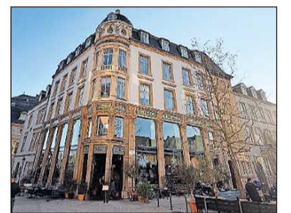
Gebäude: Renaissance bis Neoklassizismus. FOTO: GEORG ALTHERR