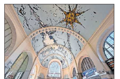
Gewölbedecke im Hauptbahnhof von Luxemburg.