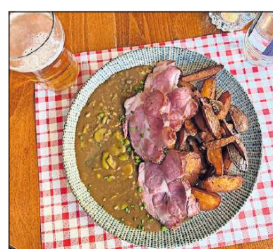
Judd mat Gaardebounen, hier leider mit Wedges, dazu schmeckt ein Boferdinger Bier.