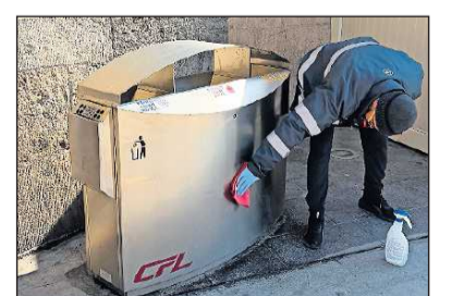
Ein Putzmann wischt die Mülleimer des Bahnhofs ab.