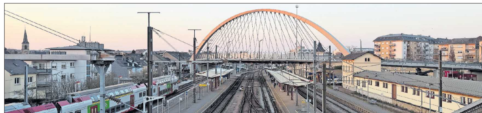
Der Bahnhof von Bettemburg in Südluxemburg: Ziemlich viele Gleise für eine Stadt mit 11.000 Einwohnern.

Ein solches kauft sich zurzeit nur eine Minderheit: 19 Prozent aller Rheinland-Pfälzer und 14 Prozent aller Saarländer.