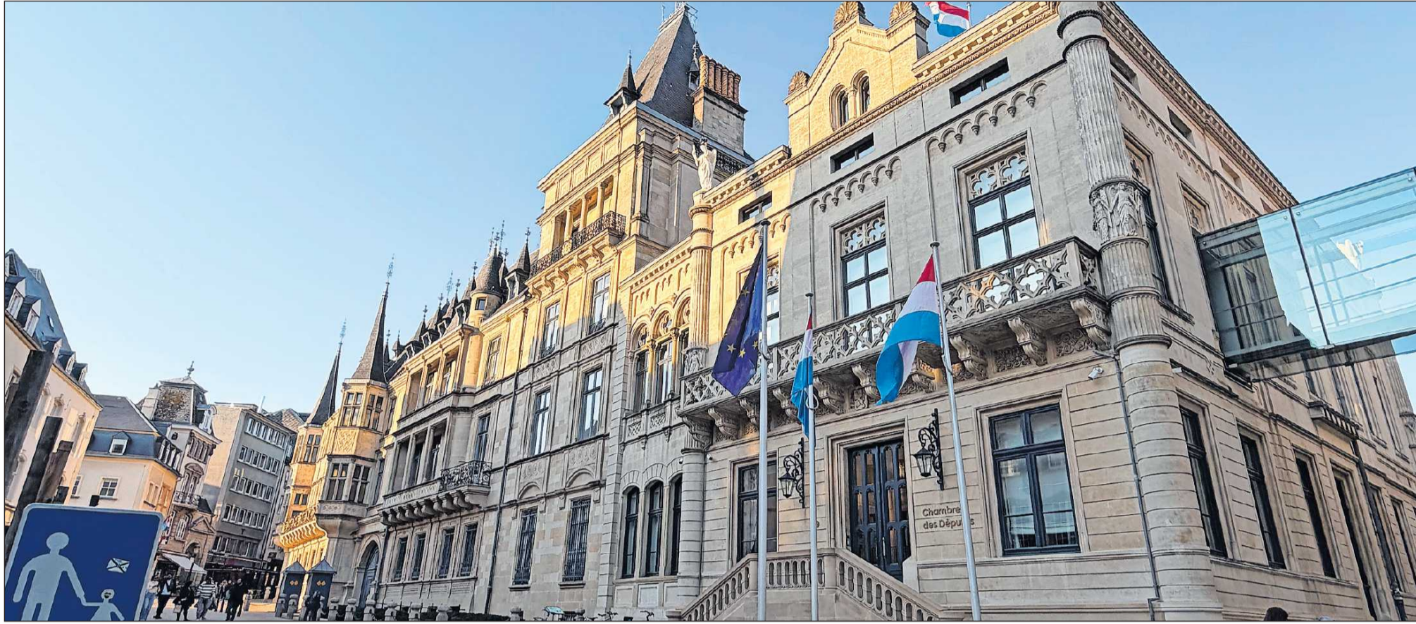
In der Luxemburger Oberstadt stehen der Palast des Herzogs (im Bild) und andere prächtige Bauten. In den Gassen rundum setzt man sich gerne ins Straßencafé, schon im März.

Wer Luxemburg kennen lernen möchte, tut das am besten per Zug, Bus, Straßenbahn und Seilbahn. Auf keine andere Weise kommt man schneller zum Ziel, vor allem nicht in der Hauptstadt. Und das beste: Der ganze Spaß kostet keinen Cent.