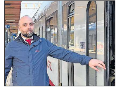
Erst wenn der Schaffner pfeift, geht's los.