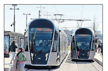
Straßenbahn: Gleise, Wagen – alles neu.